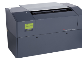
CDI Spark 2530