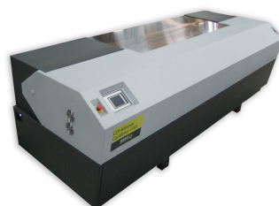
CDI Advance Cantilever 1450