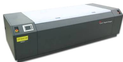
CDI Spark 5080