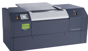
CDI Spark 4835