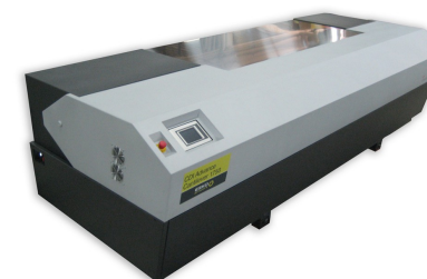
CDI Advance Cantilever 1750