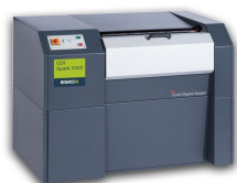
CDI Spark 2420