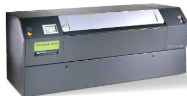
CDI Spark 4260