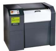
CDI Spark 2120